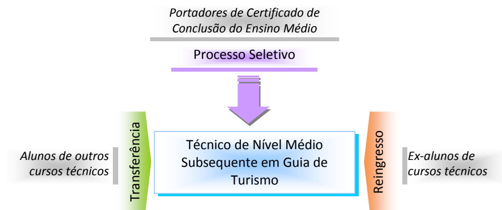
Figura 1 – Requisitos e formas de acesso ao curso.