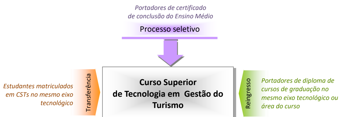
Figura 1 – Requisitos e formas de acesso

A figura 1 apresenta os requisitos de acesso ao curso: