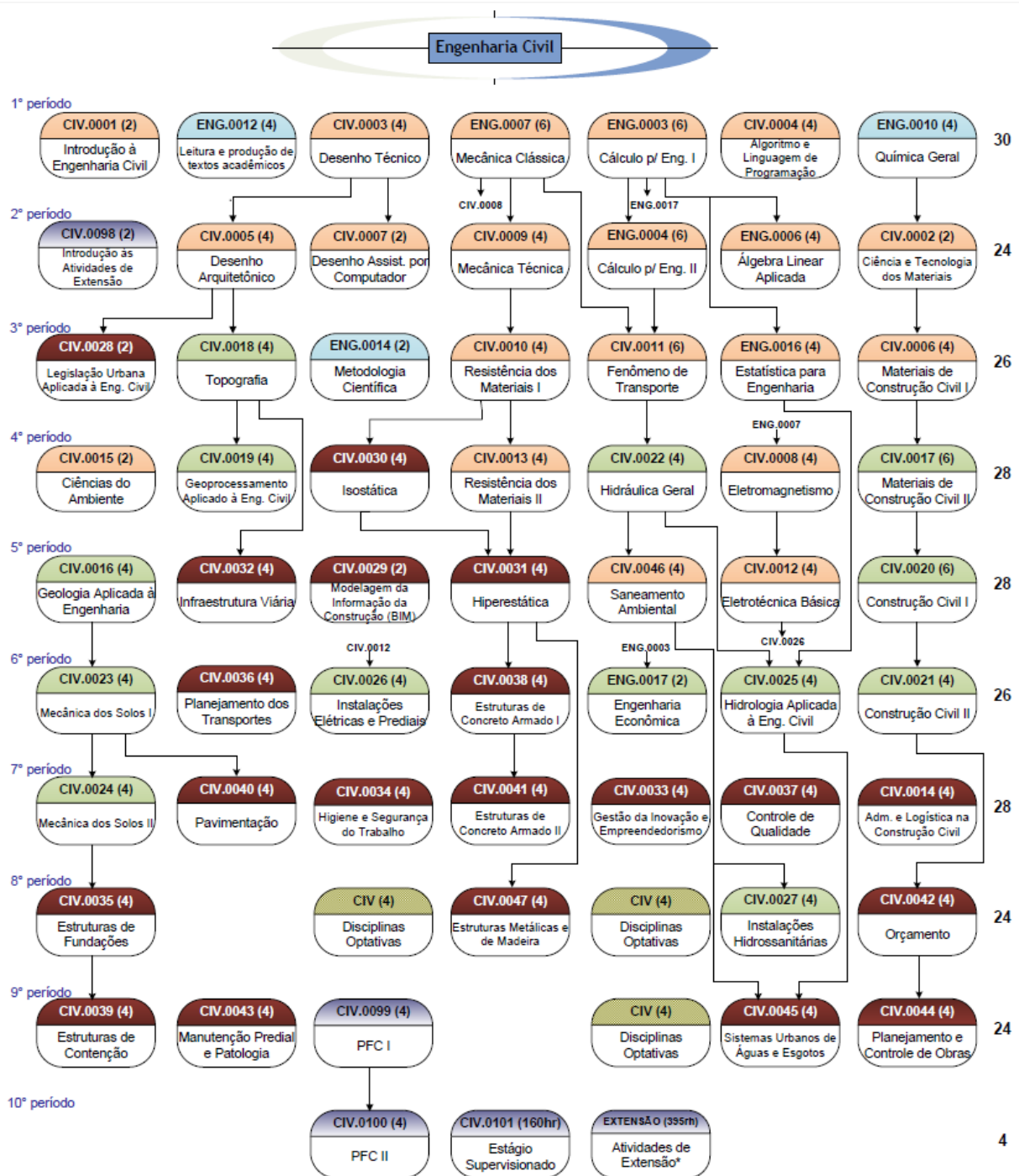
Figura 3 - Fluxograma dos componentes curriculares do curso