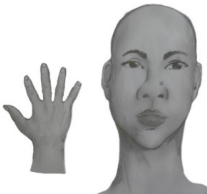
g) Perfil frontal, apresentando costado da mão esquerda