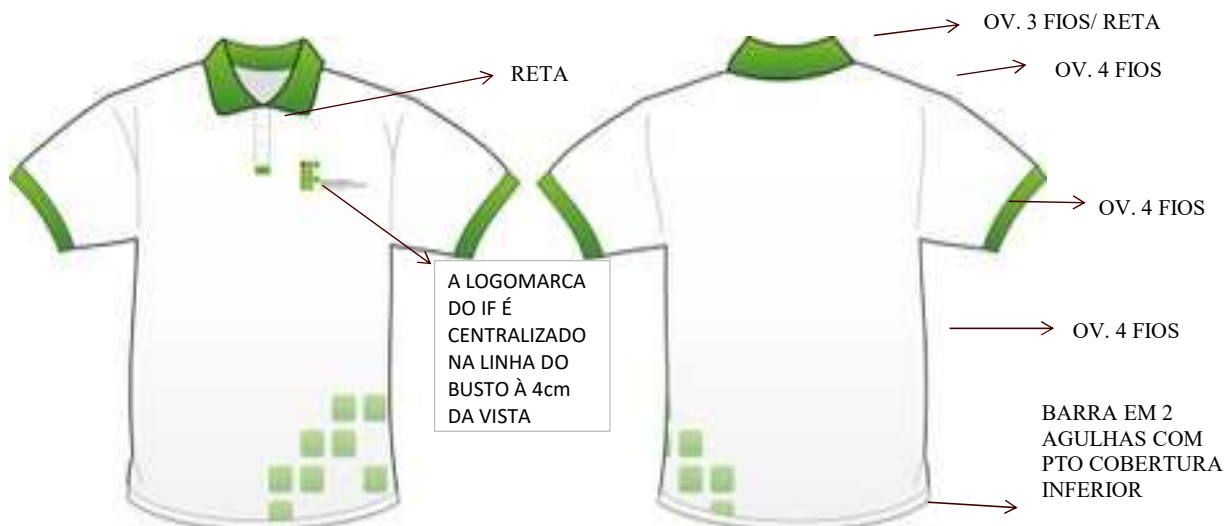
TABELA DE MEDIDAS