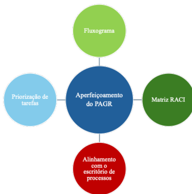
Figura 03 – principais atividades no aperfeiçoamento do PAGR.

Concluída a testagem da primeira versão do PAGR, passou-se a focar no aperfeiçoamento do documento, surgindo nova sequência de reuniões, focando nos pontos de melhoria detectados na etapa anterior. A figura 03 demonstra as principais atividades das reuniões dessa nova fase: