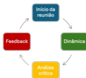
Figura 02 – fases das reuniões de testagem.

A primeira etapa visava testar e validar o documento já elaborado, utilizando dinâmicas em grupo, para receber feedback sobre o documento já elaborado. A figura 02 demonstra as fases das reuniões de testagem: