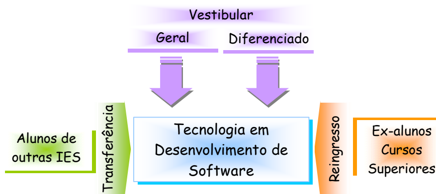
Figura 1 - Formas de Acesso