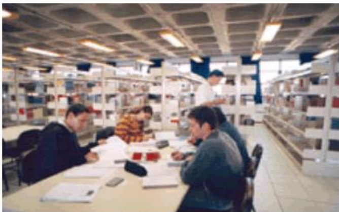
Figura 7 – Biblioteca do Campus Toledo (NÃO formate o tamanho da fonte)

Quadros, gráficos, mapas, desenhos, fotografias, plantas, fluxogramas e outros devem ter seu título identificado na parte inferior, precedida da palavra designativa, seguida de seu número de ordem.