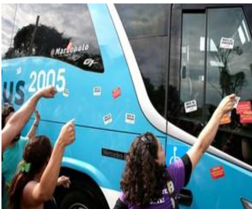
Ônibus da seleção enfrenta protestos: brasileiros diminuíram ritmo com chegada da Copa

Os números foram monitorados em pesquisa inédita da Fundação Getúlio Vargas, realizada pela Diretoria de Análise de Políticas Públicas (DAPP), que analisa os indicadores políticos do “humor” das redes sociais durante esse período da Copa. A pesquisa aponta para uma curva descendente com a proximidade da data de abertura do Mundial. As reclamações e os protestos a respeito da Copa eram acompanhados no Twitter pela hashtag #nãovaitercopa, enquanto o pensamento contrário tinha #vaitercopa e #vaitercopasim.