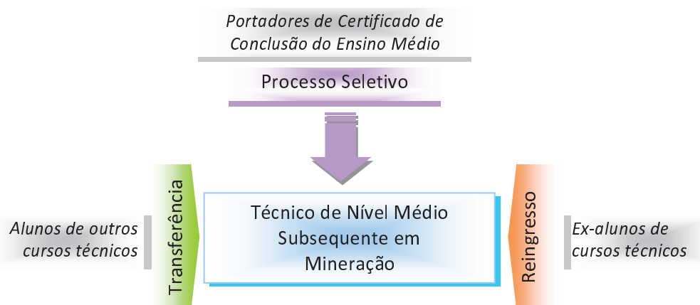
Figura 1 – Requisitos e formas de acesso ao curso.

Desse modo, as possibilidades de acesso ao Curso Técnico estão representadas na Figura 1 a seguir: