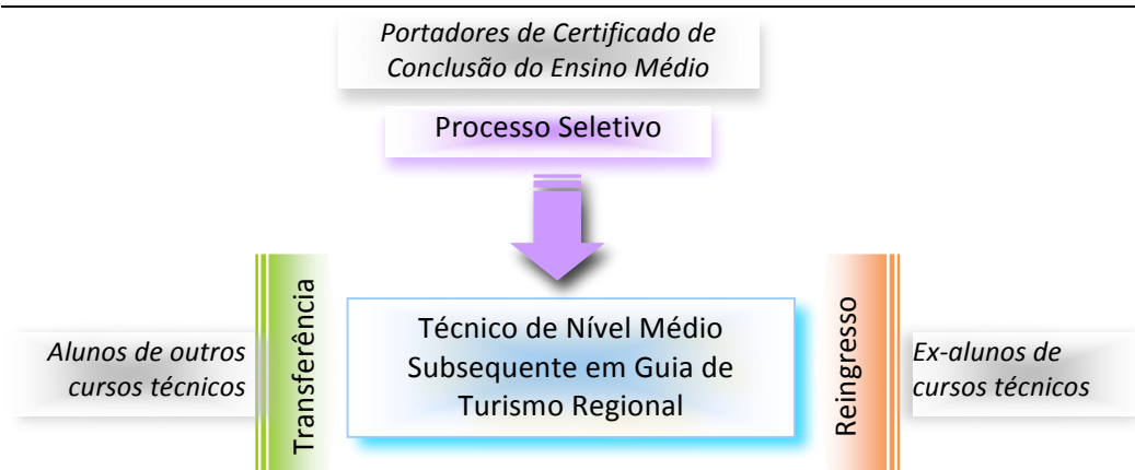
Figura 1 – Requisitos e formas de acesso ao curso.