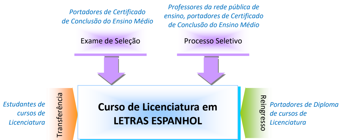
Figura 1 – Requisitos e formas de acesso discente

A oferta de turmas especiais ou a reserva de vagas em cursos de formação de professores também se constituem em mecanismos a serem adotados com o objetivo de contribuir para a melhoria da qualidade da educação básica pública. A figura 1 apresenta os requisitos de acesso ao curso: