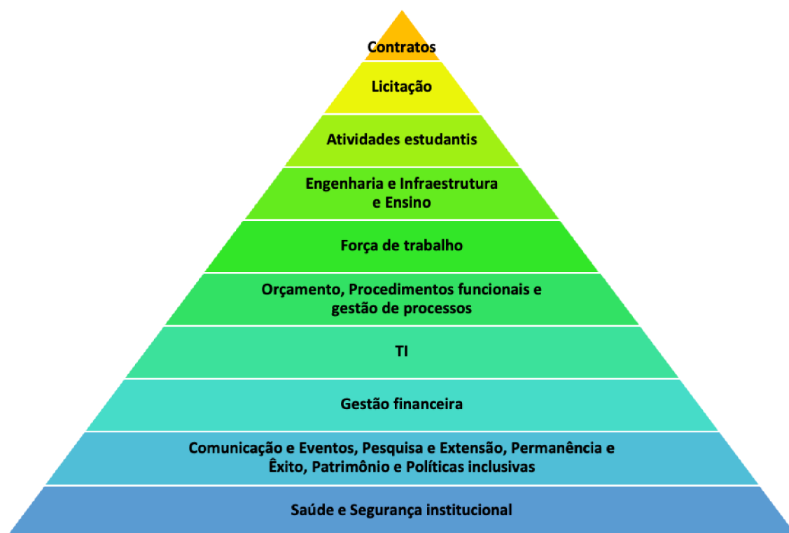
Figura 03 Relação temática dos objetos de auditoria para o PAINT 2023

A figura 03 descreve as categorias temáticas de forma hierarquizada pela quantidade de indicações dos setores.