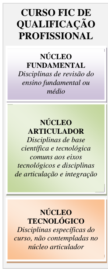
Figura 1 – Representação gráfica do desenho e da organização curricular dos cursos FIC de qualificação profissional

Convém esclarecer que o tempo mínimo de duração previsto, legalmente, para os cursos FIC é estabelecido no Catálogo Nacional de Cursos FIC ou equivalente.